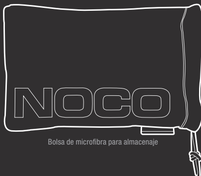
Bolsa de microfibra para almacenaje