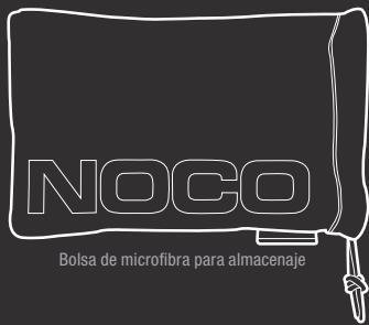
Bolsa de microfibra para almacenaje