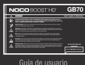
Guía de usuario